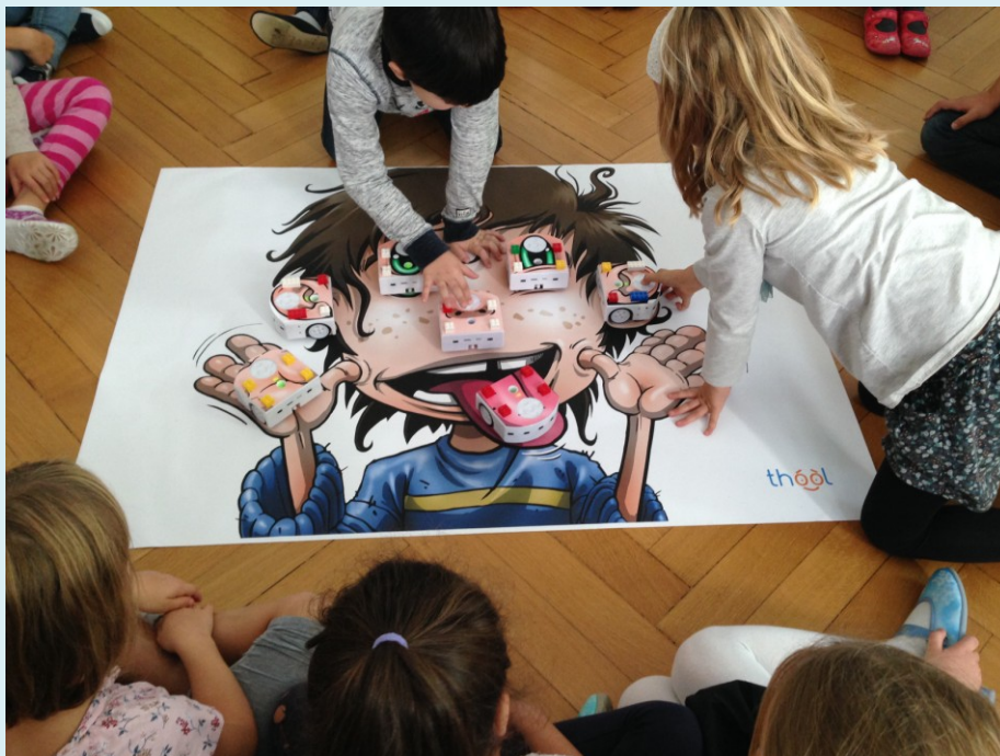
Positionnement des Thymio sur la bâche

A ce stade, le robot est en attente et les quatre LED des boutons sont allumées en rouge. Cela signifie que le robot est prêt à recevoir une commande.